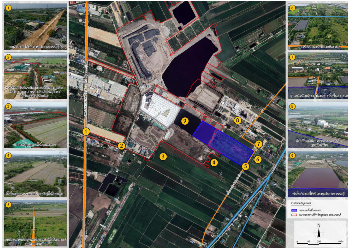
รูปที่ 1.2-2 สภาพพื้นที่โดยรอบพื้นที่โครงการ