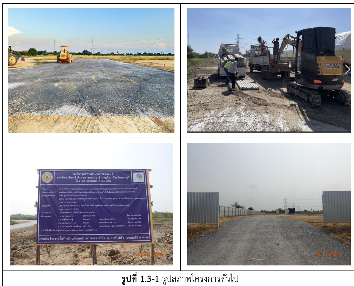
รูปที่ 1.3-1 รุปสภาพโครงการทั่วไป

การดำเนินการของโครงการผลิตพลังงานไฟฟ้าจากขยะมูลฝอย จังหวัดนนทบุรี (ครั้งที่ 1) ขององค์การบริหารส่วนจังหวัดนนทบุรี และบริษัทซูปเปอร์ เอิร์ธ เอนเนอร์ยี 8 จำกัด ในเดือนพฤศจิกายน - ธันวาคม 2566 เป็นการดำเนินกิจกรรมในช่วงก่อสร้าง โดยได้รับใบอนุญาตก่อสร้าง แบบ อ.1 เลขที่ กทพ.(อ.1)-1-057/2566 ลงวันที่ 8 พฤศจิกายน 2566 กิจกรรมก่อสร้างประกอบด้วย การเตรียมสำนักงานก่อสร้าง และงานฐานราก งานวางเสาเข็ม เป็นต้น แสดงรูปภาพโครงการทั่วไป ดังรูปที่ 1.3-1